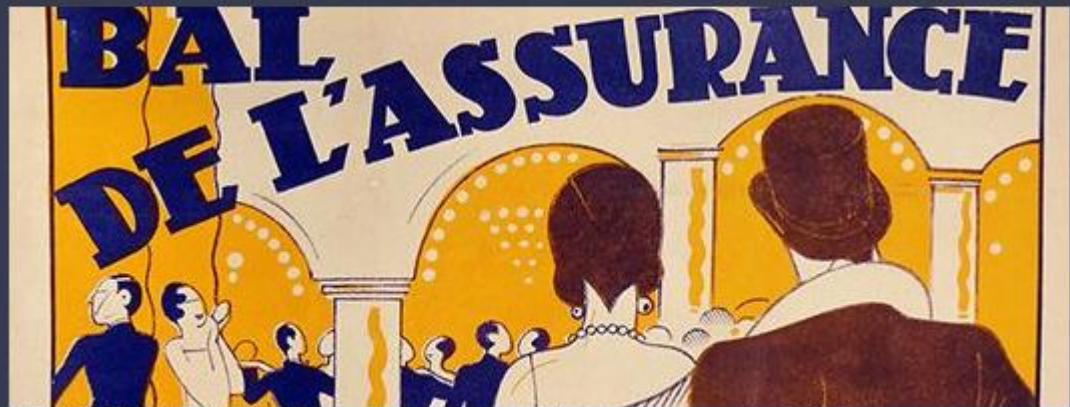
PARTICOLARE DI: Manifesto di Briot per la Amicale des Mobilisés de l'Assurance, Parigi, 1933

Sette secoli di assicurazione in mostra a Parma, APE Parma Museo, dall'11 ottobre 2019 al 15 gennaio 2020